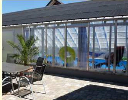
auf der Schwimmhalle