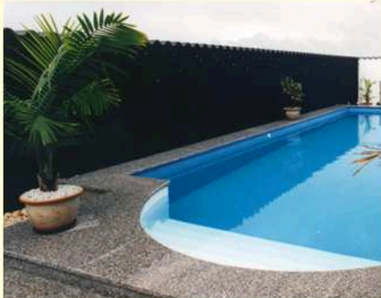
an der Wand

Der Beckenfühler misst die Temperatur des Poolwassers. Der Dachfühler übermittelt die Temperatur die beim Kollektor herrscht. Sobald es auf dem Dach 3°C wärmer ist als im Pool, beginnt die Anlage zu heizen.