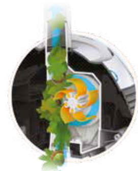
Patentierte Technologie V-Flex™: Turbine mit flexiblen Turbinenblätter für die Aufnahme großer Verunreinigungen