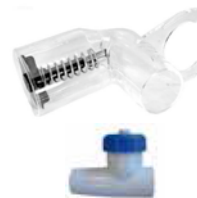
Unterdruckmesser und Regelventil